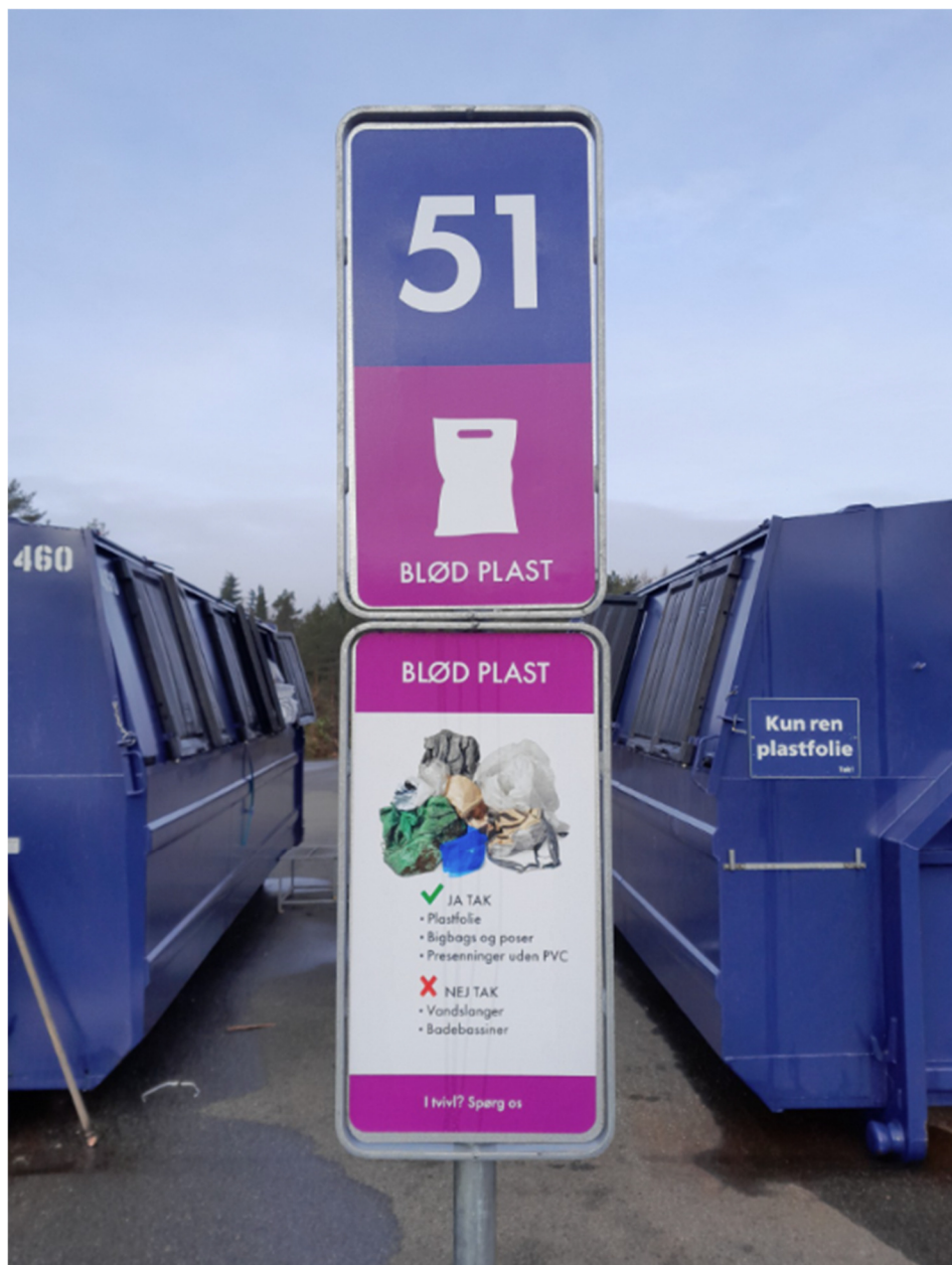
Figur 3: Forsøgsopstilling på Feldballe Genbrugsstation