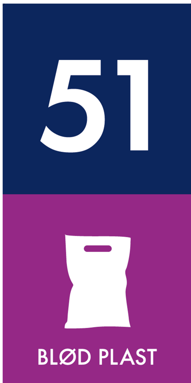
Figur 1: Topskilt